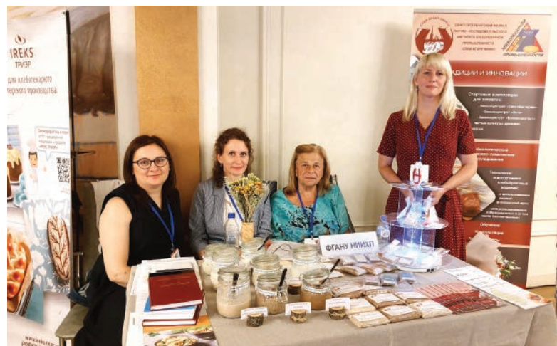
» Стенд НИИХП

Во второй части тему заморозки продолжили поставщики и производители оборудования. Они предложили участникам кейсы с использованием промышленного холода. Директор по продажам Немецкого технологического центра Вячеслав