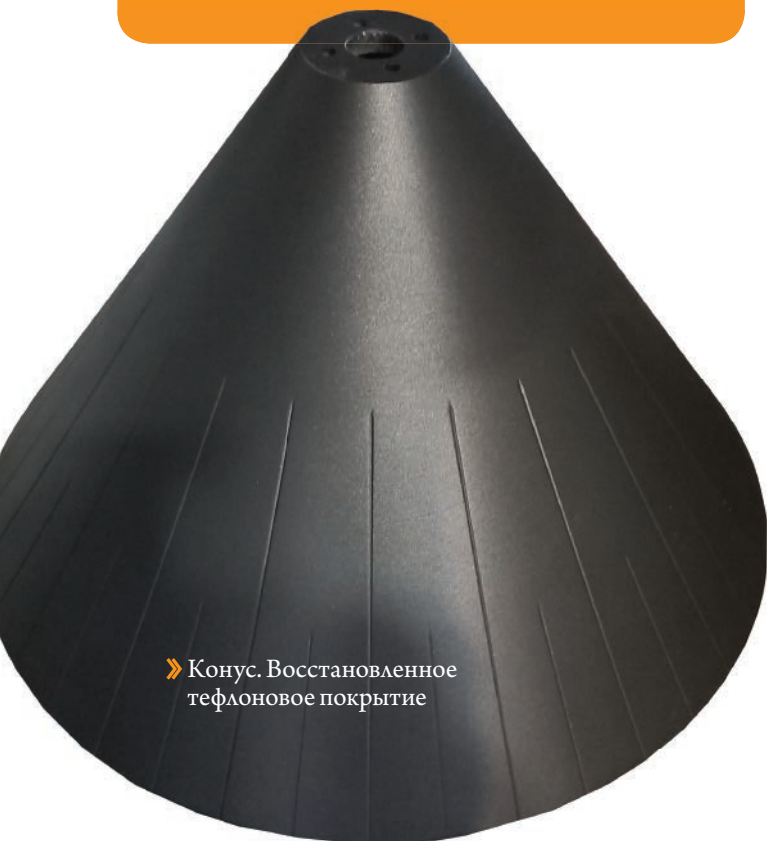
» Конус. Восстановленное тефлоновое покрытие