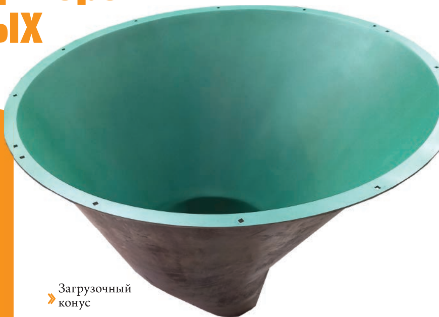
» Загрузочный конус

Пищевые производства предъявляют особые требования к качеству и безопасности оборудования. Но если речь о рабочих поверхностях, вступающих в непосредственный контакт с продуктами, то эти требования многократно повышаются. Высокая температура, воздействие агрессивных сред, давление – такое выдержит не каждое покрытие. А тефлон выдержит!