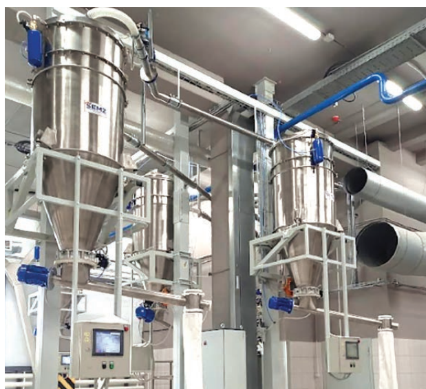
» Линия бестарного хранения муки с использованием ДМТ

Следующим важным этапом является просеивание муки для очистки от примесей и аэрации. При подаче муки пневмотранспортом эту задачу выполняет мукопросеиватель Ш2-ХМВ для непрерывного контрольного просеивания с производительностью до 6 т/ч. При подаче муки транспортными системами на основе гибкого шнека есть мукопросеиватели МПЕ-1,5 и МПЕ-3,0 с производительностью 1,5 и 3 т/ч (Табл. 2).