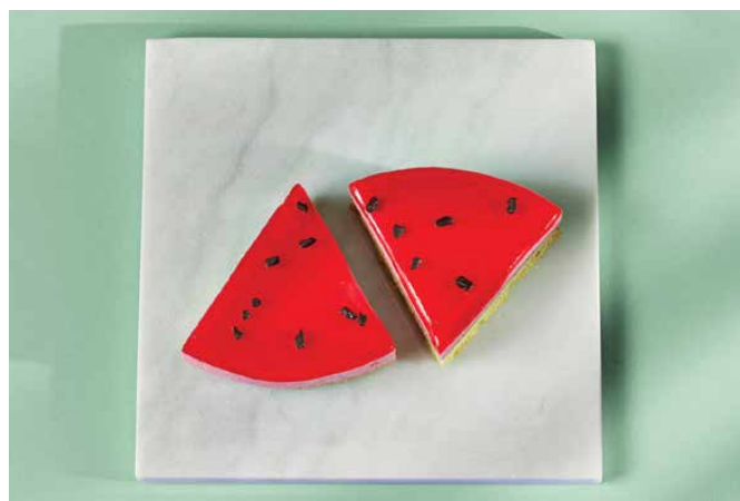
» Wassermelonen DD