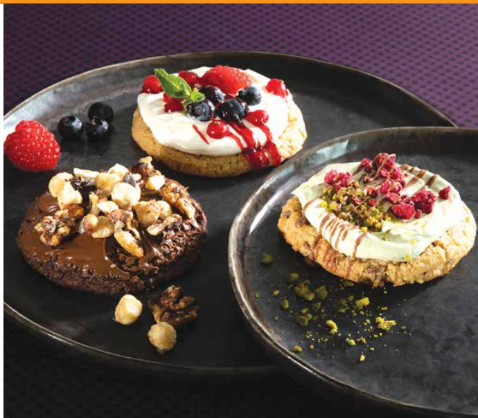
» Cookies Supreme