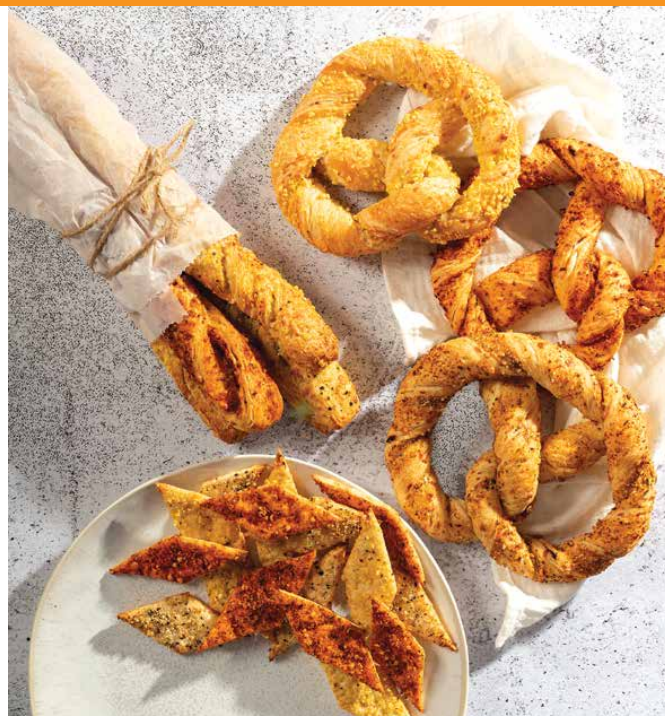
» Ireks Topping

– Я читаю ваш журнал, когда бываю в Минске, нам есть на что равняться!